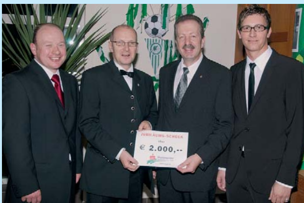
60 Jahre Sportverein Sparkasse Waidhofen/Thaya. Sportovní oddíl Sparkasse Waidhofen/Thaya oslavil 60ti leté výročí. 60th anniversary of the Sparkasse Waidhofen/Thaya sport club.

auch dieses Jahr wieder ein wichtiger Beitrag im Bereich Gesundheit, Fitness und sinnvoller Freizeitbeschäftigung geleistet.