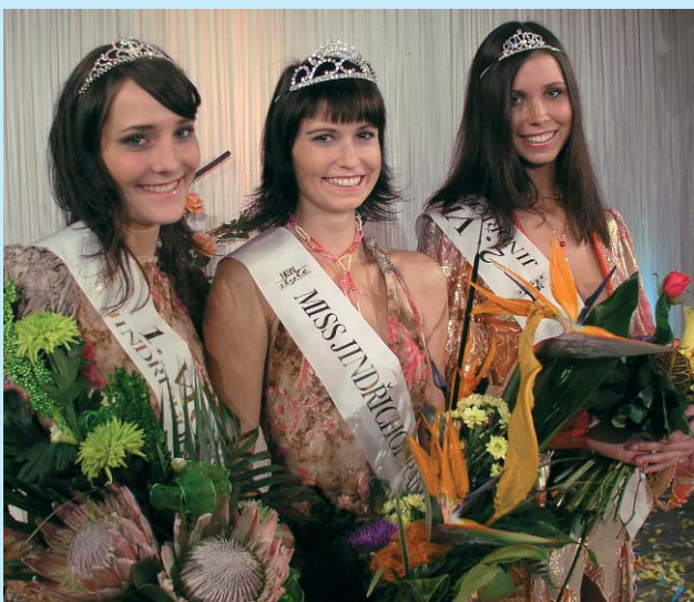
Miss Jindřichohradecka. Misswahl in Jindřichův Hradec. Beauty contest in Jindřichův Hradec.