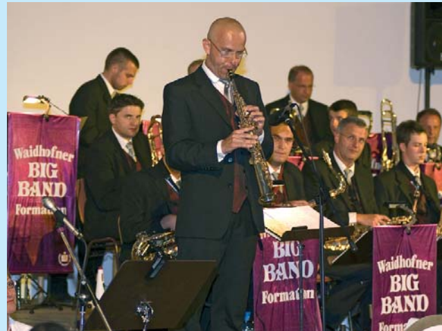
Big Band Sound on a Summer Night in the building where WSPK was founded.

Its support for the countless activities of the regional sport and gymnastics clubs made an important contribution once again to health, fitness and meaningful leisure activities.