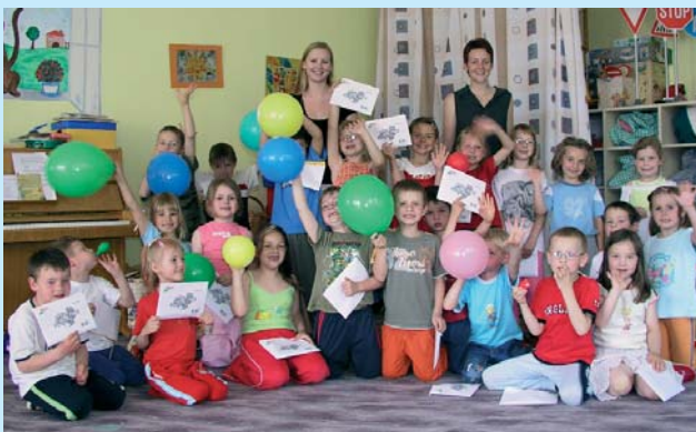
Představení KNAX klubu v mateřských školkách v Jindřichově Hradci. KNAX-Besuch im Kindergarten Jindřichův Hradec. KNAX visit to the Jindřichův Hradec kindergarten.