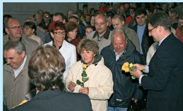
Summer theatre for customers at Jindřichův Hradec Castle.

Sommernacht im Bigband-Sound im Gründerhaus. Konzert Bigbandu v historické budově Sparkasse ve Waidhofenu/Thaya