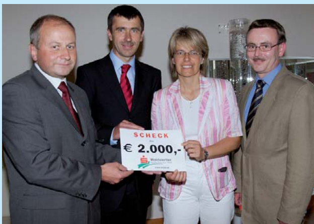
Neuer Sinnesraum für das NÖ Landespflegeheim. Nová společenská místnost domu pro seniory. New "sensory room" at the Lower Austrian state nursing home.