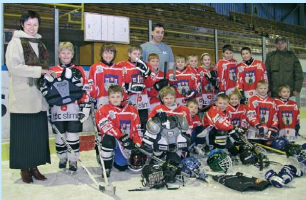
Nová výzbroj pro mladé hokejisty Spartaku Pelhřimov. Neue Ausrüstung für Jugendeishockeymannschaft Pelhřimov. New equipment for the Pelhřimov junior hockey team.