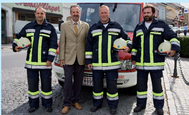
Neue Ausrüstung für die Freiwillige Feuerwehr Brunn. Nová výzbroj pro dobrovolné hasiče z Brunnu. New equipment for the voluntary fire department in Brunn.