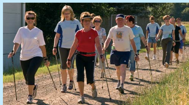
Nordic walking day with WSPK.

Sommer-Theater für Kunden im Schloss Jindřichův Hradec. Divadelní představení pro klienty Sparkasse na zámku v Jindřichově Hradci.